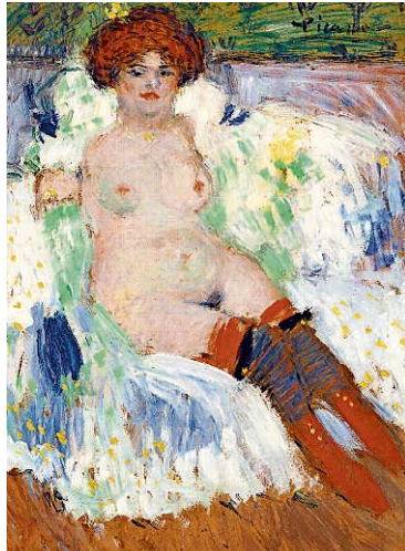
Pablo Picasso malte 1901 den Akt „Nu aux bas rouges“.

„Die Schau will das Viertel Montmartre dem Klischeehaften entreißen“, fügt Hollein hinzu. Historische Fotografien zeigen einen Straßenzug mit stattlichen, mehrstöckigen Gründerzeithäusern und direkt daneben Holzhütten, Gestrüpp und enge Gassen. Genau in diesem Viertel fanden Künstler billigen Wohnraum, genossen künstlerische Freiheit, und entdeckten in den Bewohnern und Straßenszenen ihre Themen, die die Kehrseiten der