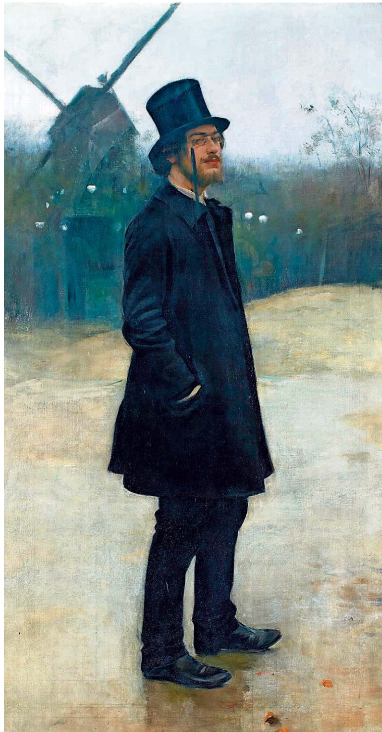
„Le Bohème, poète de Montmartre“: Den versunkenen Komponisten Erik Satie malte der katalanische Künstler Ramon Casas 1891. Das Foto unten zeigt Montmartre im Jahr 1904.

Doch die Künstler entwickelten keinen voyeuristischen, sondern einen realistischen Blick. So widmen sich Gemäldegruppen dem dörflichen Montmartre oder den Varietés und den Tänzerinnen. Breiten Raum nimmt die Aktmalerei ein vom Malermodell bis zur Darstellung von Prostituierten. Die Bewohner des Viertels wie Wäscherinnen und Bettler bilden ein weiteres Motiv, ebenso Zirkusleute und die Künstler, die sich selbst und gegenseitig